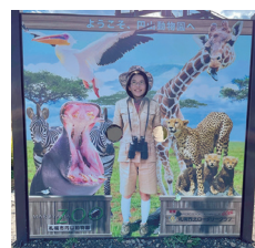
札幌 円山動物園にて