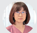
吾妻放射線科部長