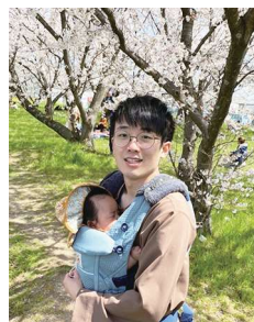
息子と重信川河川敷にて