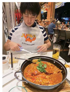
シンガポールにて