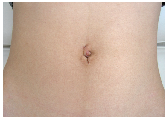
【TANKO手術後】 (傷はおへその一部です)

お腹を切開して腫瘍を摘出する場面を想像されるかたが多いのではないのでしょうか。近年、カメラやエナジーデバイスの技術進歩により、お腹の中をカメラで覗きながら小さな切開創から手術道具を出し入れして腫瘍を切除摘出する腹腔鏡下手術が一般化してきました。西条中央病院の産婦人科では2019年から腹腔鏡下手術を導入しました。2020年の1年間における産婦人科腹腔鏡下手術は33件でした。うち全腹腔鏡下子宮摘出術5件、腹腔鏡補助下子宮摘出術10件、腹腔鏡下卵巣腫瘍手術18件でした。また病状により可能と判断されればTANKO手術という、お臍の一箇所の傷だけでおこなう術式も導入しています。腹腔鏡手術は低侵襲で術後回復が早く、美容的にも優れているのでこれまでのところ大変好評をいただいております。地域の先生がたにおかれましては子宮筋腫、子宮脱、卵巣腫瘍など婦人科疾患の患者さんの紹介をお願いします。ただし悪性腫瘍、巨大な子宮筋腫、高度な癒着が疑われる場合は愛媛大学、愛媛県立中央病院、松山赤十字病院などに紹介しております。