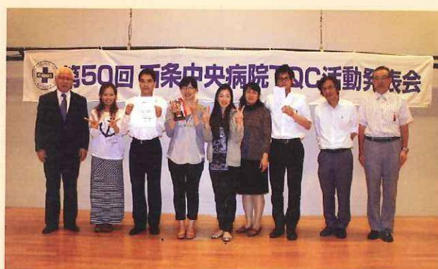
院長賞(健康管理センター)