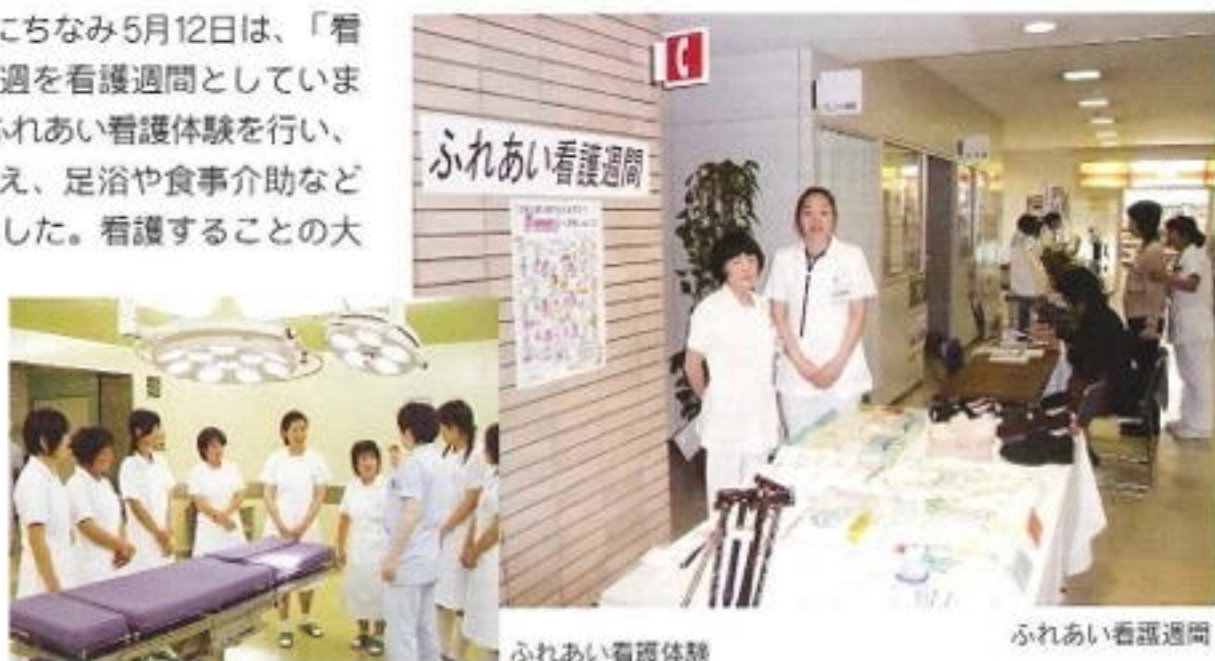
ふれあい看護体験